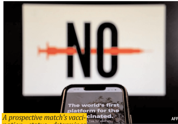
A prospective match's vaccination status determines compatibility not just for Renee, a self-employed Australian, but for many posting in "unvaxed singles" groups that have cropped up on Facebook.

Dating decisions there are driven by chemistry but not science. In one closed group breached by AFP, many listed "no jabbies" as their top dating criteria, while others cheered anti-vaccine advocates as "pure blood freedom fighters." One meme popular in the group described their ideal partner: "She's curvy, funny,