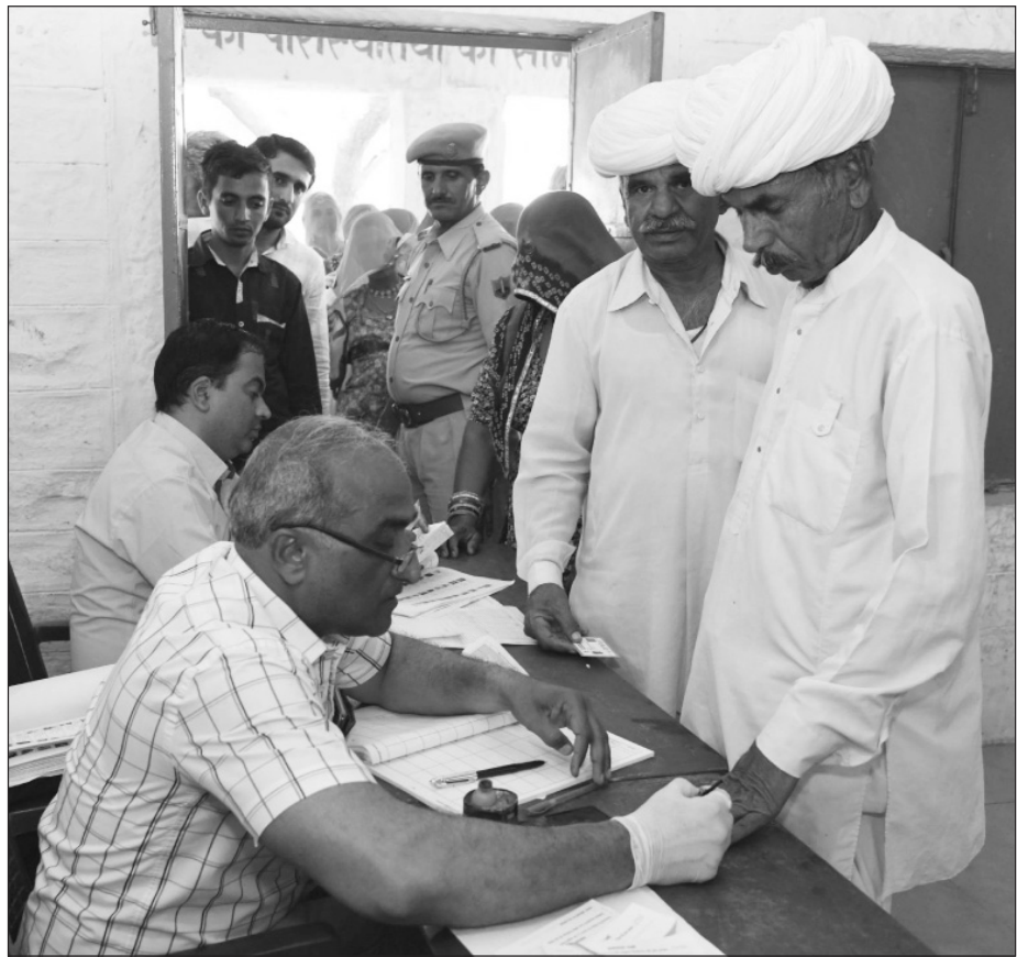
A polling official administering indelible ink to a voter, at a polling booth, during the 4th Phase of General Elections-2019, at Jodhpur, in Rajasthan on April 29, 2019.