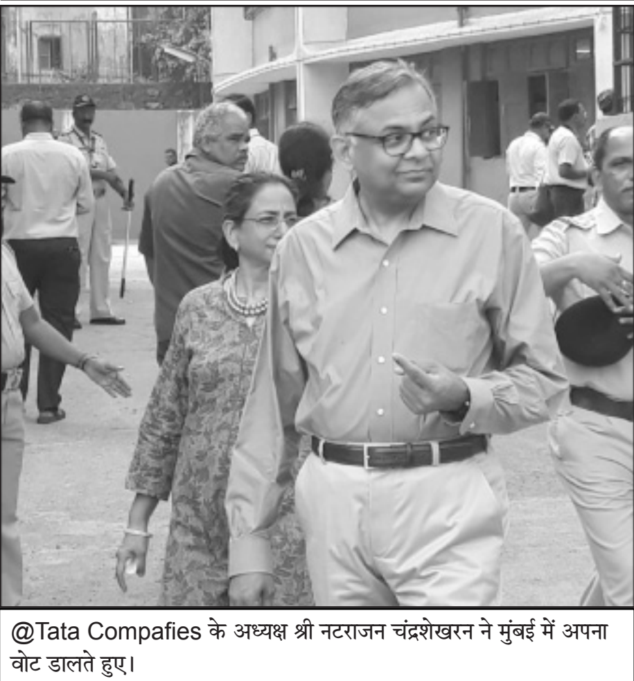
@Tata Compafies के अध्यक्ष श्री नटराजन चंद्रशेखरन ने मुंबई में अपना वोट डालते हुए।

नई दिल्ली, 27 अप्रैल (ह.सं.) ऑनलाइन पर अनजान युवकों के साथ मोबाइल फोन पर गेम खेलने की लत ने एक कारोबारी दंपती के रिश्ते में दरार पैदा कर दी है। अब ऑनलाइन मोबाइल गेम की लत ने दंपती को तलाक की दहलीज पर लाकर खड़ा कर दिया है। दंपती के बीच आपस का रिश्ता कई वर्षों से कमजोर है। इस बार अब कारोबारी पति पर उसकी पत्नी ने चरित्र पर शक करने व मारपीट करने का आरोप लगाया है। पत्नी को शिकायत पर महिला कोतवाली पुलिस ने केस दर्ज कर जांच शुरू कर दी है। उत्पीड़न की शिकायत महिला अपने पति व तीन बच्चों के साथ सेक्टर-50 में रहती है। पति कारोबारी हैं, जबकि वह घर धरें लू महिला है। महिला ने पुलिस को शिकायत दी है कि बच्चे पढ़ते हैं और वह घर में अकेली पड़ जाती है, इसलिए पिछले कुछ महीनों से वह मोबाइल फोन पर ऑनलाइन गेम खेलती है। यह गेम ऑनलाइन मौजूद कुछ अनजान लोगों के साथ खेला जाता है। एक माह पहले गेम खेलने के दौरान कुछ अनजान युवकों ने उन्हें अश्लील मैसेज भेजे। इसका उन्होंने विरोध भी किया। वह मैसेज उनके पति ने देख लिए। तभी से वह उन्हें मारते पीटते हैं, जबकि वह उन युवकों को ब्लॉक तक कर चुकी है। शक के चलते कारोबारी पति ने पत्नी का मोबाइल फोन तक छीन लिया है। पिछले एक माह से मोबाइल फोन नहीं होने के कारण वह गेम नहीं खेल पा रही है। समय व्यतीत करने के लिये वह मोबाइल फोन गेम खेलती थी। इससे उनका मन हल्का हो जाता था, लेकिन पति को यह भी बर्दाश्त नहीं हुआ। अब कारोबारी पति अपनी पत्नी फंसाते के लिए उन युवकों के साथ ऑनलाइन गेम खेल रहे हैं। वह उनसे गंदी बातें कर उनके खिलाफ सबूत इकट्ठा कर रहे हैं, ताकि वह उससे अलग हो सके।