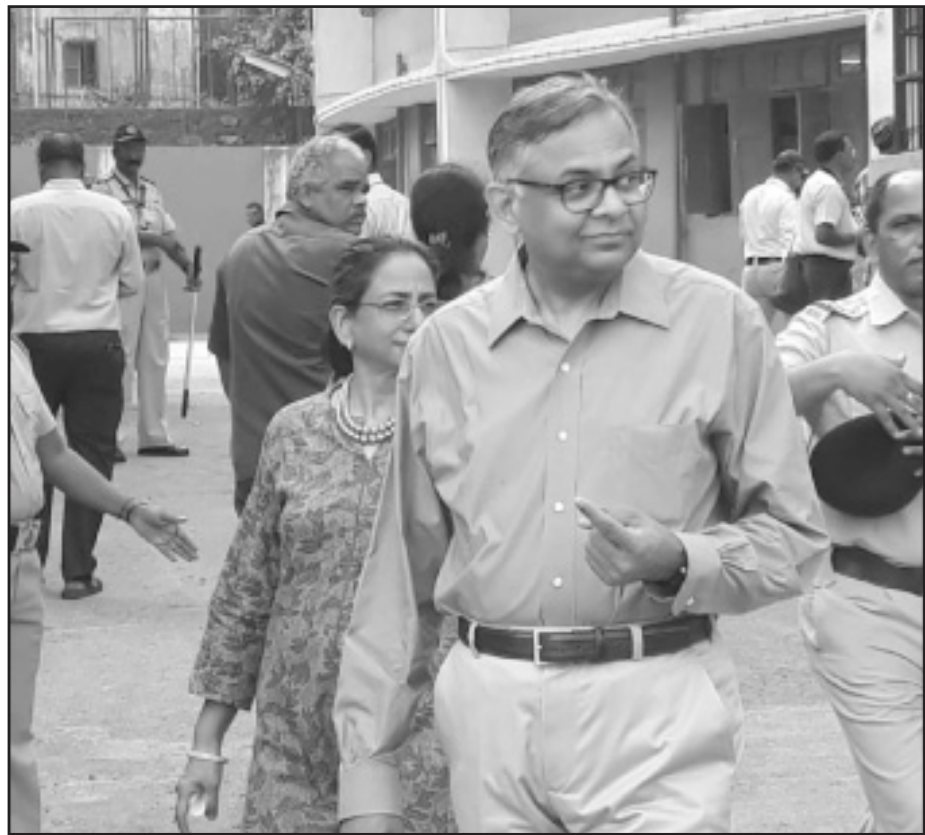
Chairman of @TataCompanies Shri Natarajan Chandrasekaran casts his vote in Mumbai.

"I am sad that the BJP and Congress together are spreading lies about the religion of our East Delhi candidate," said Sisodia in a tweet. "The BJP and Congress men! Be aware that her full name is Atishi Singh. She is a Rajputani. A hardcore Kshatriani... the Queen of Jhansi."