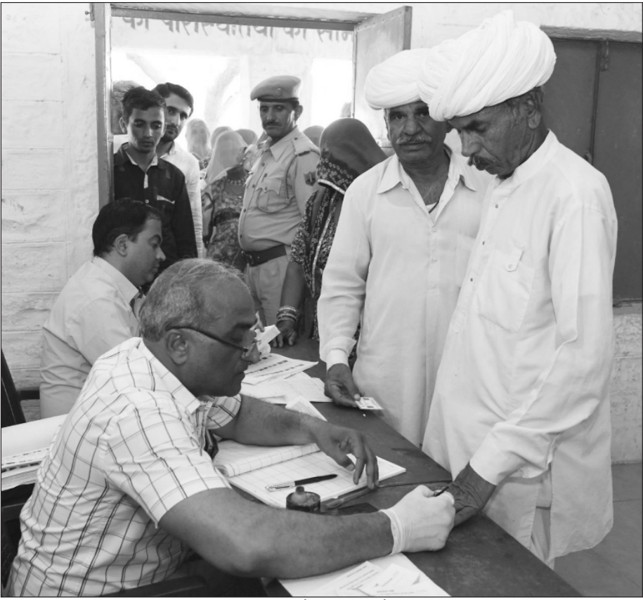
राजस्थान के जोधपुर में, सामान्य चुनाव -2019 के चौथे चरण के दौरान, एक मतदान केंद्र पर, एक मतदाता को एक अमित स्याही देता मतदान अधिकारी।